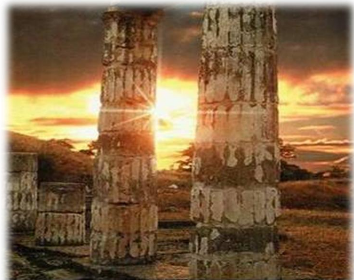
(Пантикапей – столица Боспорского царства)

Кубань имеет очень бурную историю: многие племена и народы ступали на эту землю - основывали свои города-колонии древние греки, вторгались полчища гуннов, хазар, печенегов, половцев и монголо-татар. Были и колонии итальянских купцов, поддерживающих тесные связи с адыгейскими племенами.